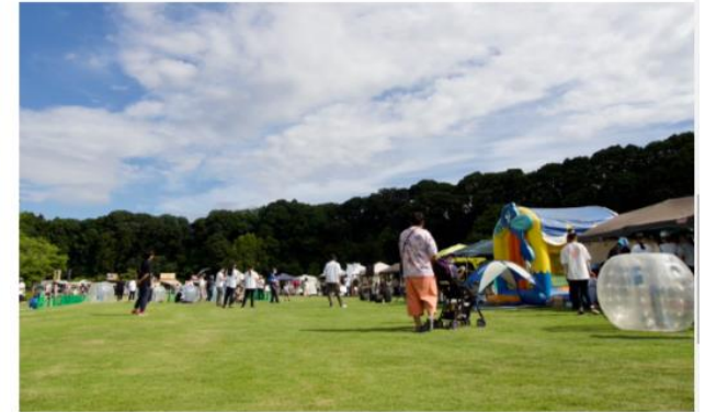
国際会議や地域のイベントなど