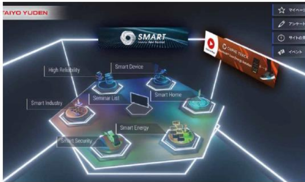
リアル展示会の併設（ハイブリッド）開催

それぞれのシーンに必要な機能を組み合わせる事で、 様々なイベントに活用できます。