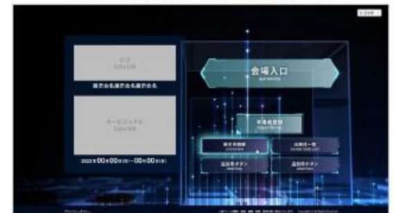
TOPページ (ログイン前)