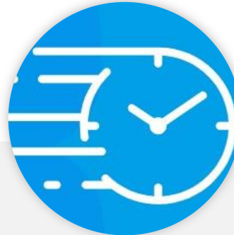
スピーディーな開催

デザインテンプレートを選択して、必要項目を入力、製品やサービスの画像を反映させるだけで公開が可能です。主催者様がセルフで構築出来るレベルの簡単な操作性を実現しました。もちろん当社で構築サポートをさせていただくことも可能です。