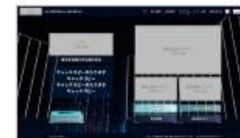
メインページ (ログイン後)