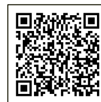
ランディングページ QRコード

Smart e-Messe専用ランディングページ、デモページを用意しています。 是非実際にランディングページやデモページをご覧ください。