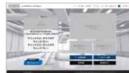
メインページ (ログイン後)