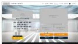
メインページ (ログイン後)