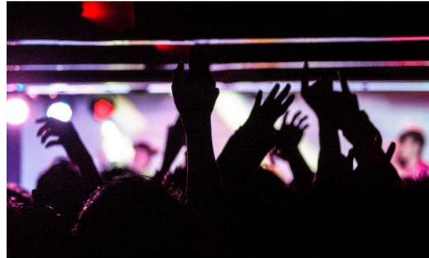
企業や団体のプライベート開催