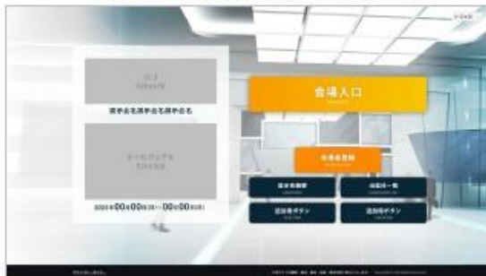
TOPページ (ログイン前)