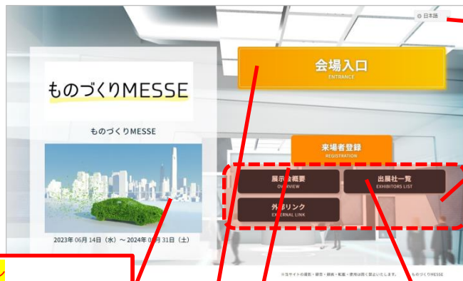
TOPページ（ログイン前）

TOPページから来場登録→ログイン→出展社ページ→製品ページと分かりやすい導線。 多言語対応（日本語・英語・中国語）も可能です。