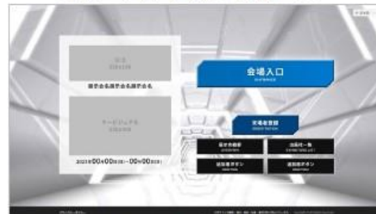
TOPページ (ログイン前)