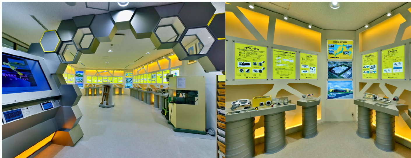
イワタボルト 本社ショールーム

【リアル体験によるブランディング戦略】と【オンライン施策によるプロモーション活動】の二つの軸によって、常設展成果の最大化を目指します。 企画・準備、施設設営、施設運営、プロモーションをトータルで企画立案・実行します。 ショールーム・店舗の設計・施工は是非ご相談ください。