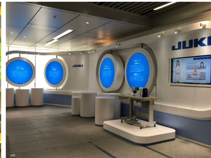
JUKI 本社エントランスショールーム