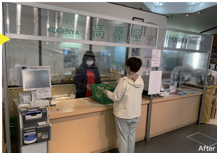
2020年4月21日 西名阪道の針ICに併設された道の駅 針テラスの つげの畑 高原屋(農産物直売所)にキャッシャーシールドが設置されました。